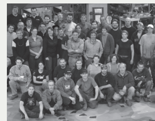
Cette photo de l'équipe de Scène Éthique est fixée sous la scène et voyage avec la tournée