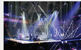
La « forêt » en répétition