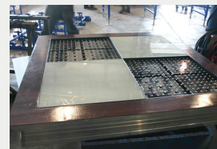
Des tuiles DEL dans le nouveau panneau de scène en aluminium