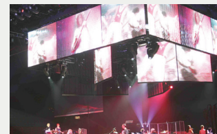
Les écrans DEL en répétition