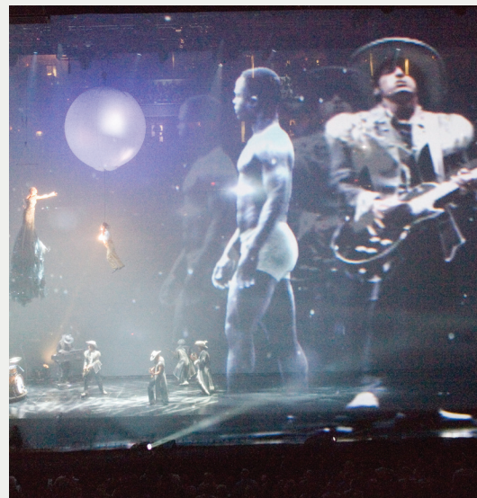
Mountain of Clothes / Time To Go avec acrobates / musiciens voyageant sur les rails acrobatiques

Deux rails acrobatiques de plus de 54 mètres de longs étaient suspendus au-dessus de la scène. Chaque rail était muni de trois chariots qui se déplaçaient horizontalement à l'aide d'un système de motorisation DRD de Scène Éthique. Chaque chariot transportait un treuil pour les mouvements verticaux. Ces rails étaient conçus pour des charges humaines (des acrobates et des musiciens) et servaient aussi à déplacer des décors.