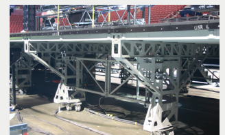
Le porte-à-faux de la scène