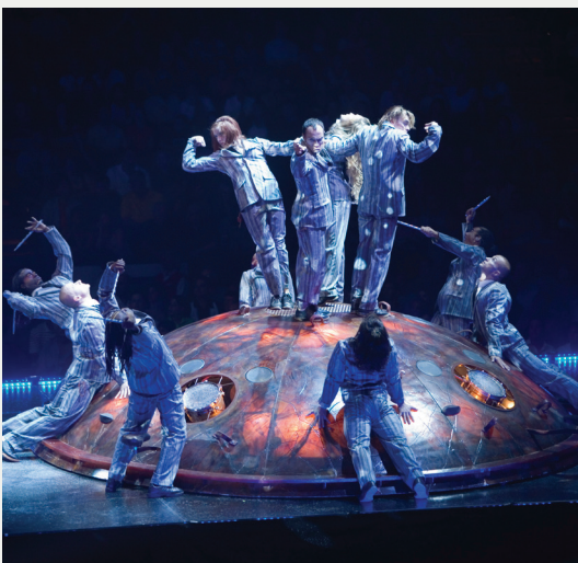
Le numéro Spiritual Spiral / Too High sur un élément de décor fabriqué par Scène Éthique

La scène était d'une longueur de 54 mètres et d'une profondeur de 9 mètres sur scène et de 12 mètres en coulisse. La scène reposait sur une structure de bases pliantes munies de « roues tortues ». Les panneaux de la scène utilisaient le système OST de Scène Éthique avec les attaches PTL pour former une surface uniforme offrant des caractéristiques structurales impressionnantes. La surface de la scène était recouverte d'un tapis athlétique peint. Certains panneaux étaient munis de trappes et le bord de la scène était en porte-à-faux de 1.5 mètres permettant l'installation d'équipements de sonorisation et d'éclairage.