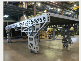
Une section de la scène sur ses «roues tortues»