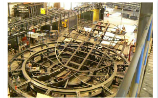
Table tournante avec plateau oscillant