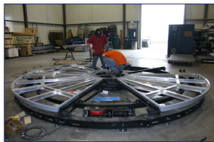
Table tournante Scène Éthique 1620 en montage

Dû à sa simplicité de montage et à sa robustesse, la table tournante Scène Éthique 1620 est aussi un équipement idéal pour la tournée et la location. La table tournante Scène Éthique 1620 peut être dotée d'un contrôle simple de vitesse et de sens de rotation variable.